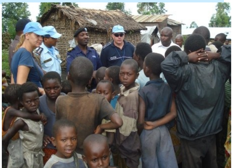
Equipe conjointe PNC/ Police MONUC/ Observateurs civils échangeant avec la population locale